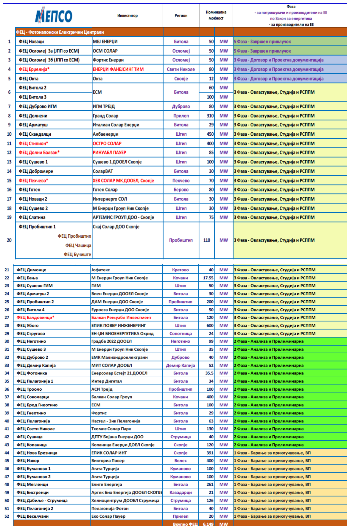
Табела 6. Фаза на постапка на ФЕЦ